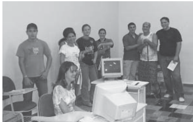
Ao lado esquerdo alunos do 2º Ano de Pedagogia encenando um telejornal e acima a turma do 1º Contábeis “A” repletando as diversas formas de liderar uma empresa.