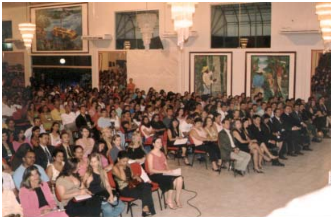
Aproximadamente duas mil pessoas passaram pelo auditório da AVEC durante o evento.

Constituição Federal, para que os mesmos tenham o controle das contas do poder público. Mas frisou com pesar,