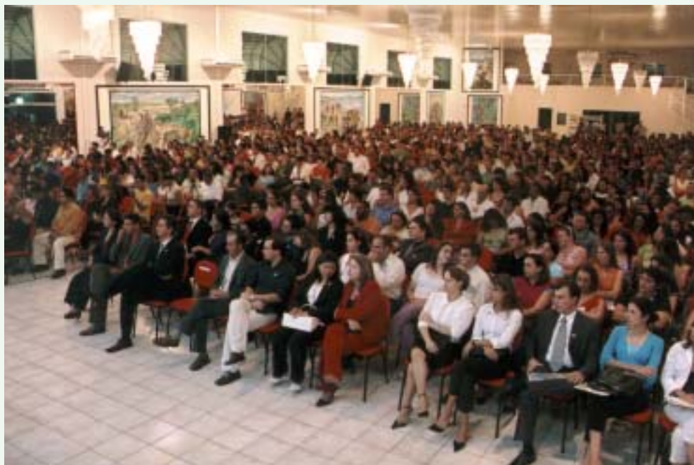
Foi grande a presença do público nas palestras do simpósio.