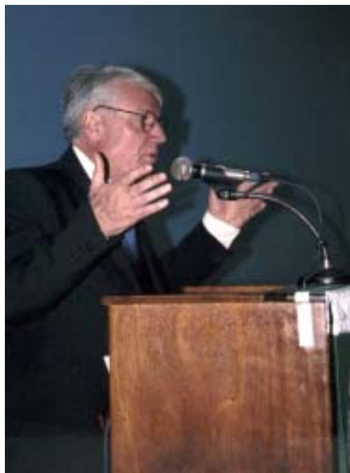
O senador, Amir Lando, explica a complexidade da Previdência Social.

empenho como Ministro para preservar e resgatar a imagem da previdência social no país. Amir Lando ressaltou que existem inúmeras irregularidades realizadas por quadrilhas e até mesmo parentes dos beneficiados. Após a morte do beneficiado os fraudadores ainda conseguem receber o benefício no lugar dos finados parentes. “A previdência precisa de decência, eficiência e ética, só assim ela