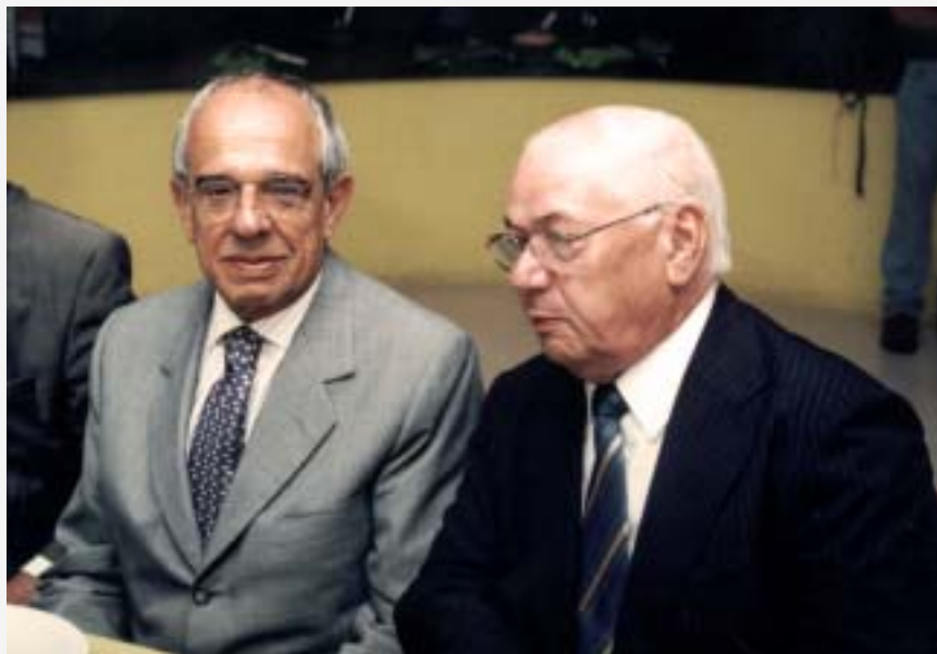
Ministro da Justiça e Prof. Gonzaga em conversa reservada

Após o jantar, realizado no restaurante Degustare, Márcio Thomaz Bastos foi conduzido até um hotel, onde no dia seguinte prosseguiu viagem para cidade de Costa Marques para o lançamento da “Operação Brabo”, a maior operação em conjunto da Polícia Federal Brasileira e da Polícia Boliviana, em prol do combate ao narcotráfico na região de fronteira.